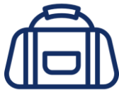
Sportbeutel Sport bag

Ihr Kind benötigt für den Sportunterricht: Your child will need: